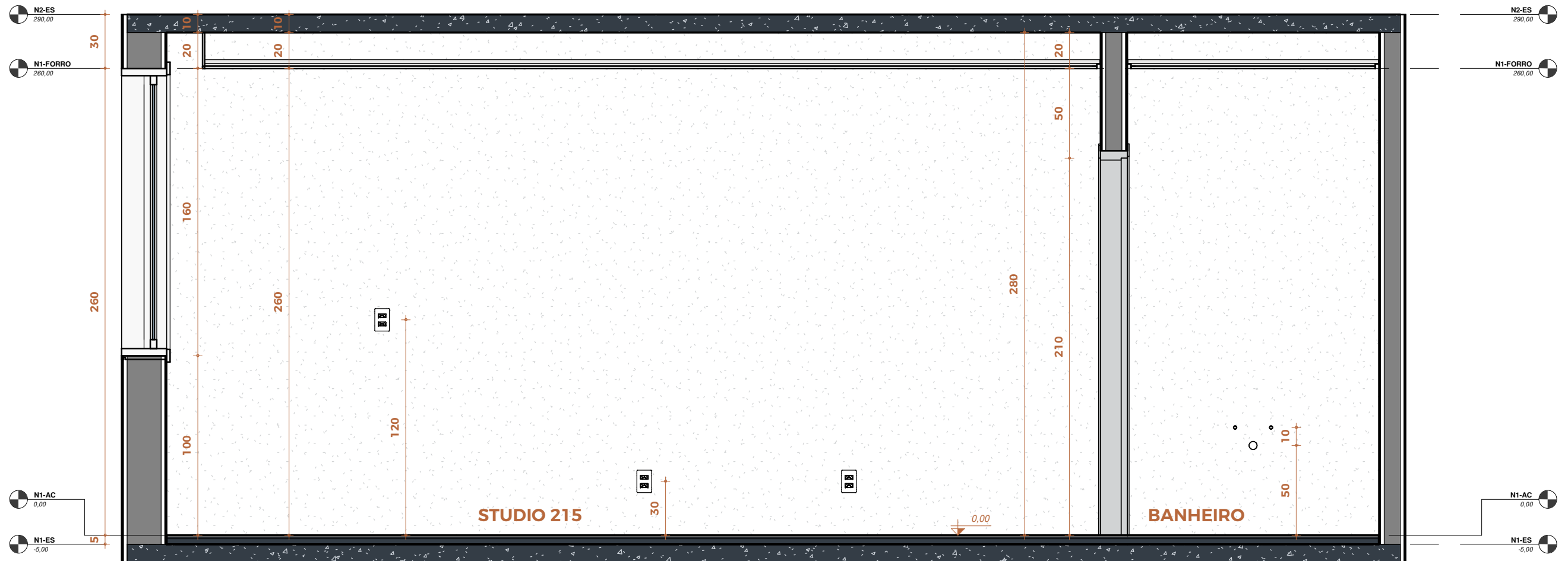
1 CORTE 01 Escala: 1 : 25